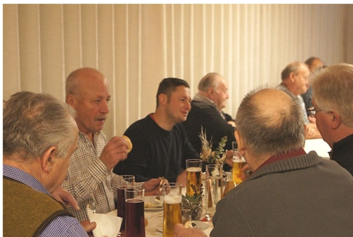
Es immer wieder schön wenn sich bei unseren Jahreshauptversammlungen die Mitglieder gut verstehen und eine Gaudi haben.